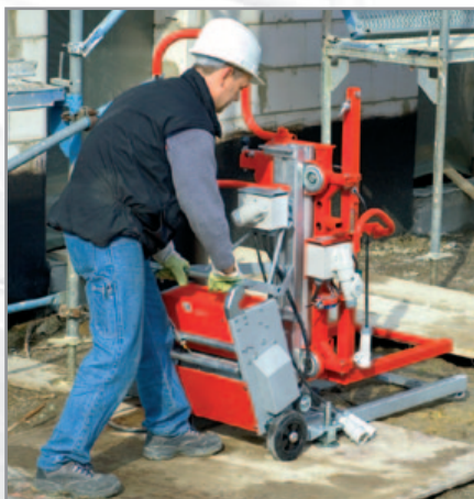
Transport – Die mit Vollgummirädern ausgerüstete Grundeinheit lässt sich auf der Baustelle bequem verfahren.