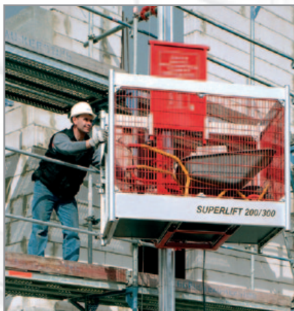
Lastbühne – Die schwenkbare Lastbühne ermöglicht den Einsatz auch an engen Baustellen.