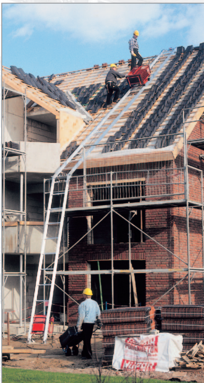
S225 Antriebseinheit auch einsetzbar beim Toplift 225 Universal