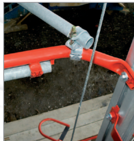
Befestigung des Mastes – Der Alu-Mast kann stufenlos am Gerüst bzw. Gebäude verankert werden.