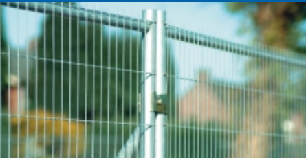
Heras M200 Anti-Climb. Durch die schmale Masche viel sicherer.