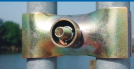
Teil der neuen Sicherheitsnorm: die Hochsicherheitsklammer.